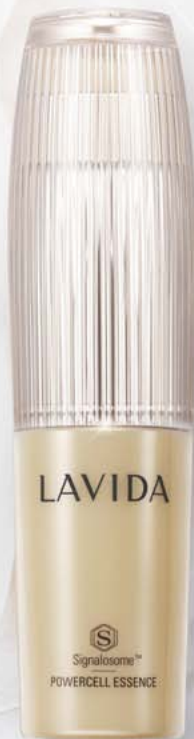
라비다 파워셀 에센스 에스 드림 투게더 에디션 [주름 개선 · 미백 기능성] 120ml / 95,000원