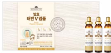
웰빙라이프 발효 태반 V 앰플 20ml X 30병 (1개월 분) / 250,000원