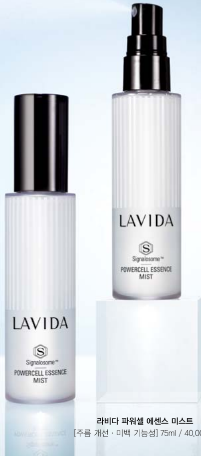
라비다 파워셀 에센스 미스트 [주름 개선 · 미백 기능성] 75ml / 40,000원