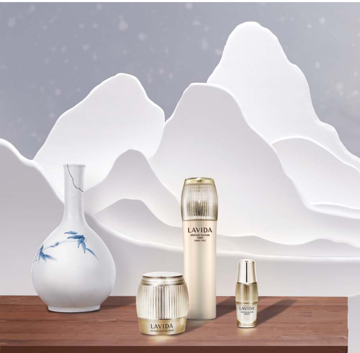
백자청화매죽문병 白磁靑畫梅竹紋瓶